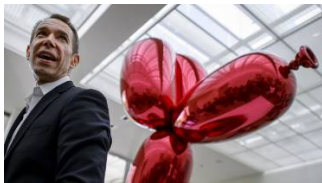
🕒 22 novembre 2016 Jeff Koons offre une œuvre originale à Paris