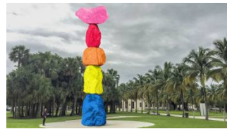
🕒 14 novembre 2016 L'expo internationale Art Basel Miami Beach rend hommage en passant à David Bowie