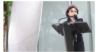
🕒 20 octobre 2016 Yoko Ono dévoile sa première installation artistique permanente aux États-Unis