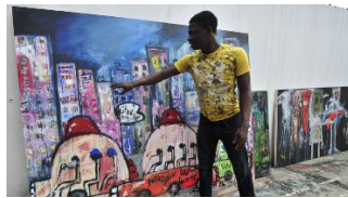
🕒 16 novembre 2016 Côte d'Ivoire: le peintre Aboudia, roi des "Mogos"